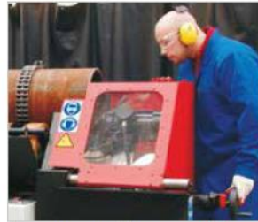
Koruyucu cam plaka ve iç aydınlatma operatörünün emniyet ve konforunu artırır.