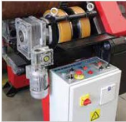
Kolay kullanılmalı kontrol paneli