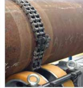
Ayarlanabilir zincir (ø200-1000mm). Pozitif aksensel dönüş.