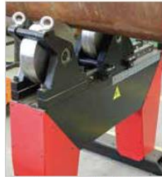
Ağır hizmet ayarlanabilir boru desteği