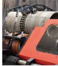
Boy 400-830mm aralığında kısa boruları sıkıştırma aparatı.