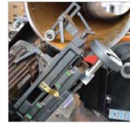
Oval boru düzleme ekipmanı (opsiyonel)